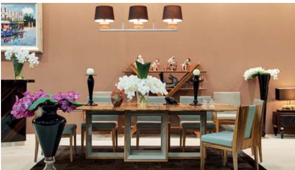
Стол Volpi представлен в салоне Giorgio Concept

Мебельная выставка Isaloni в Милане – всегда грандиозное событие. Судите сами: это крупнейшее мероприятие подобного рода в Европе, где под экспозиции выделяют 28 павильонов. Но нас интересует зал №6. Именно там приоткрылись дебютанты этого года – Louis Kazan. Любителей классики его незамысловатая мебель поначалу сбивает с толку: никакой резьбы и завитушек, а цены приличные. Однако его привлекательность как раз в простоте – поясняют дизайнеры. Но не все так просто.